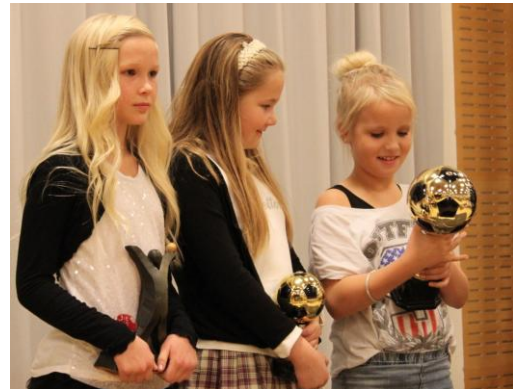
Pikkukenttien tyttöpelaaajien eliittiä.